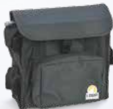
Mala de transporte Art.nr.: DLL-SOFTCASE

Pretende saber se esta impressora portátil se adapta às suas necessidades?