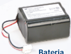
Bateria Art.nr.: DLLOBOBAT