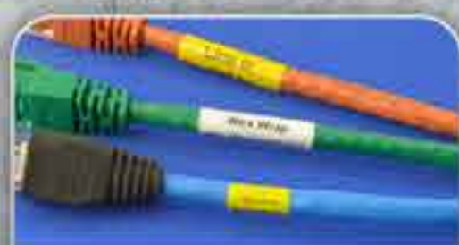
IDENTIFICAÇÃO DE CABOS