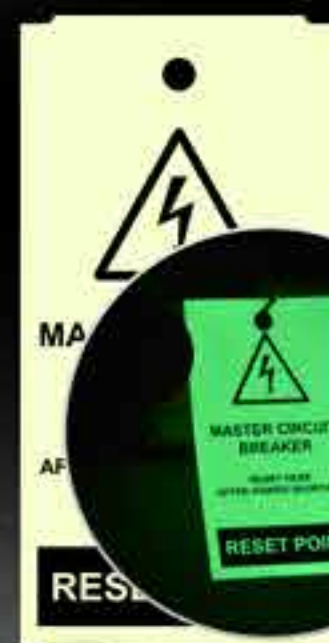
NEW! ReGLO Fotoluminescentes

E ainda, o SMS TAG-ID é ideal para as seguintes aplicações industriais: