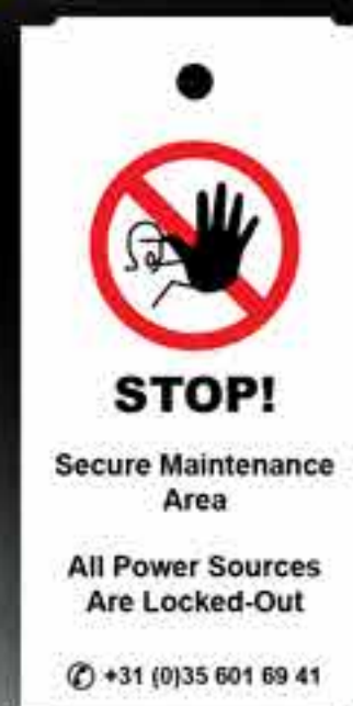
Branco Mensagens personalizadas