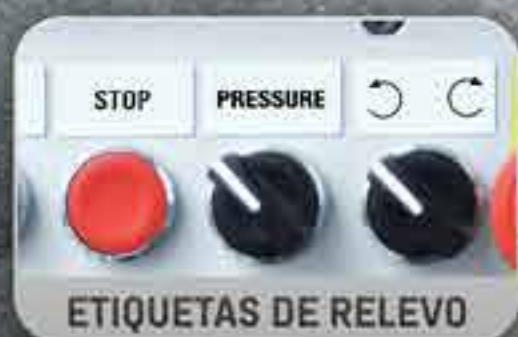
ETIQUETAS DE RELEVÓ