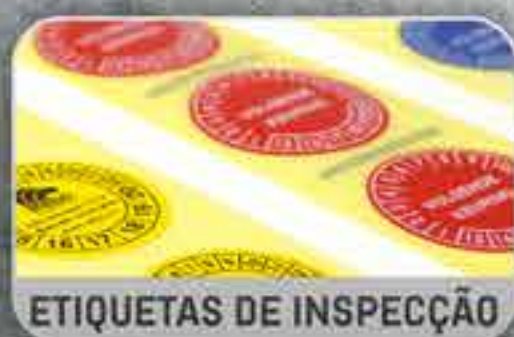
ETIQUETAS DE INSPECÇÃO