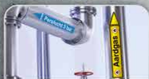
MARCAÇÃO DE CANOS

E ainda, o SMS TAG-ID é ideal para as seguintes aplicações industriais: