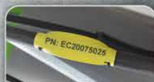
TAGS PARA CABLAGENS