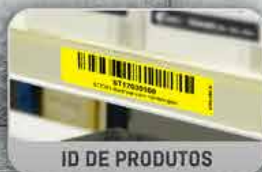
ID DE PRODUTOS